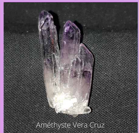
Améthyste Vera Cruz

Les pierres violettes : Améthyste, Amétrine, lépidolite, Sugilite, cordiérite (lolite), Fluorite violette, Kornéropine, Kunzite, Scapolite violette, Tanzanite, Taaféite, Spinelle violet, Purpurite, Smisthonite violet,